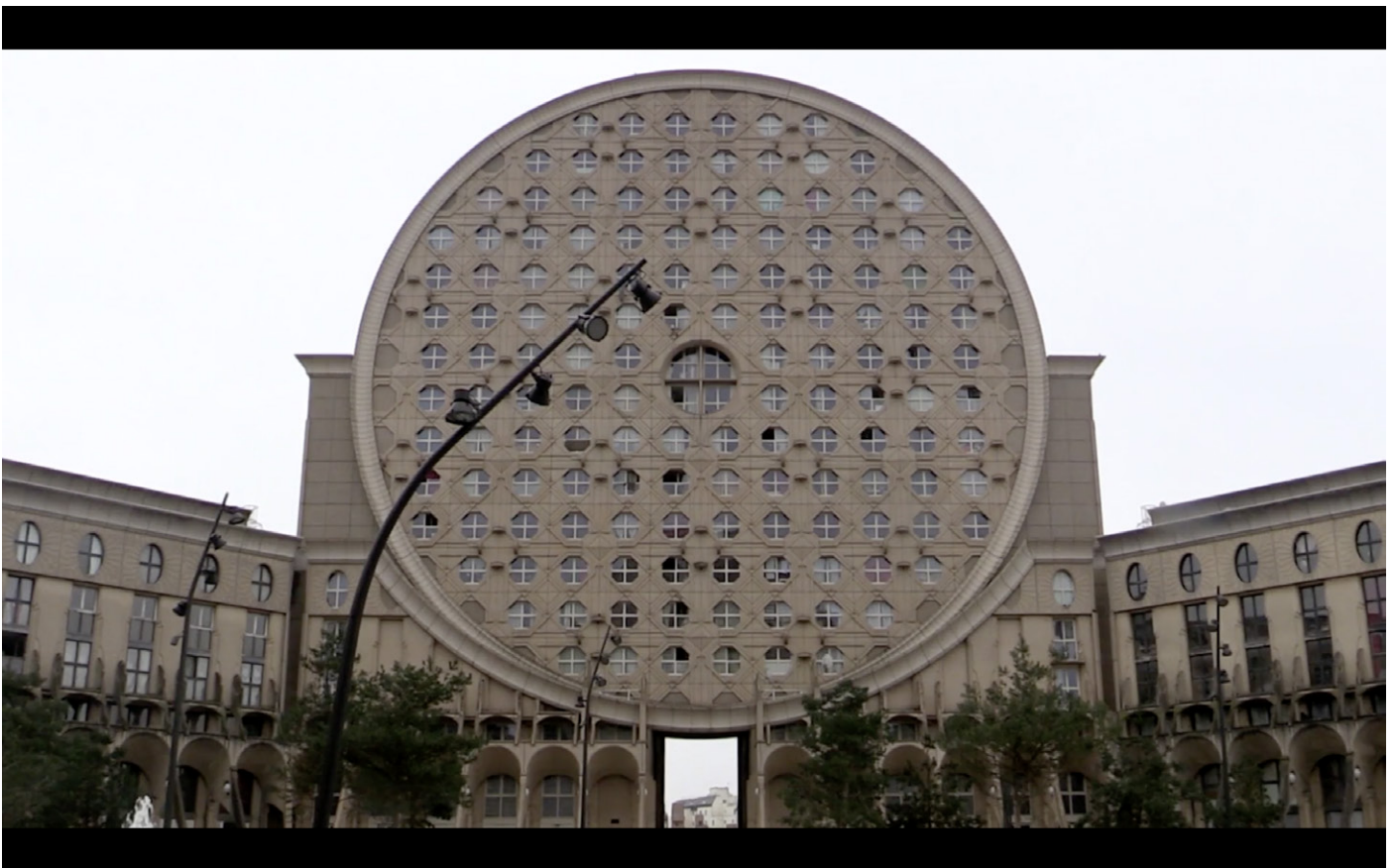
MEMORY VIDEO-BALLAD OF CONTOUR - 2017 (still)