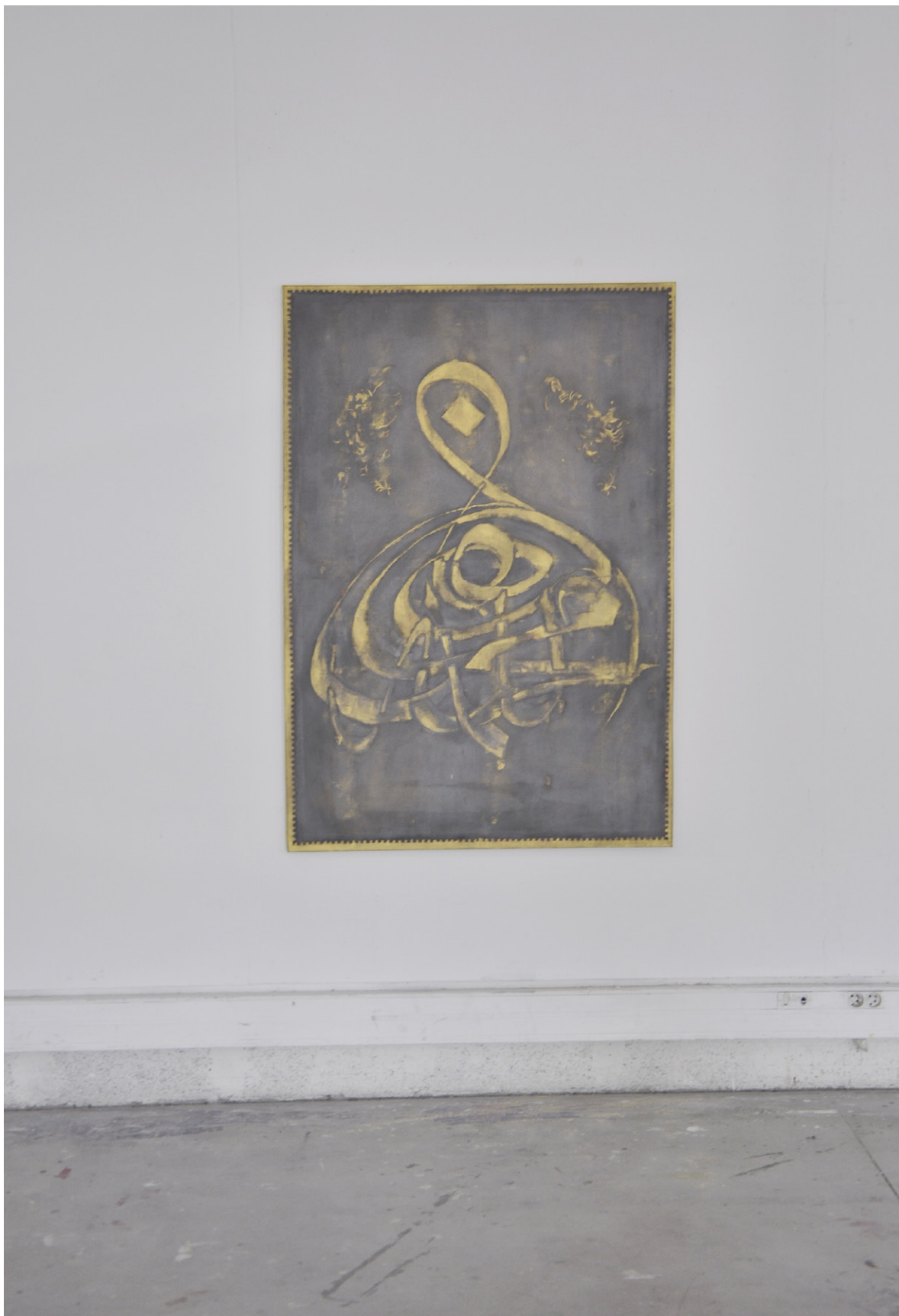
MOUSSON MOTIF ANONYME - 2018