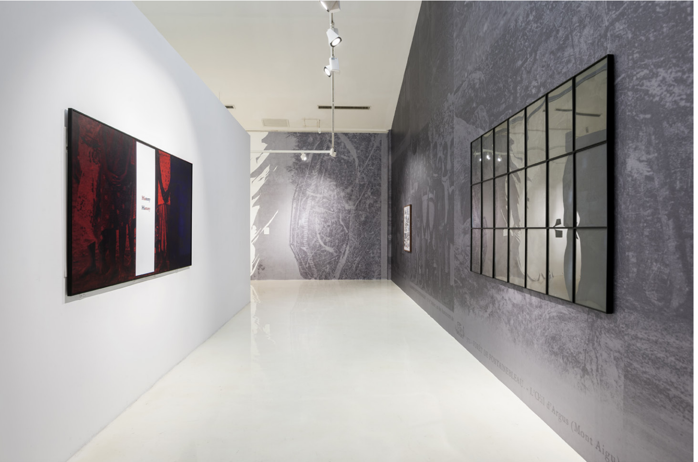
vue d'exposition personnelle 2017