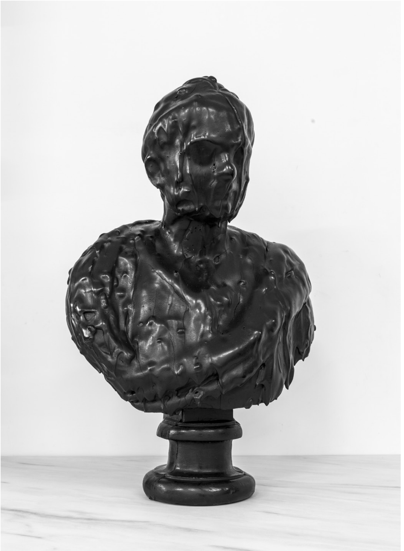
BLACK PLASTERS : FAUSTA, IMPÉRATRICE ROMAINE, 2022

Plâtre, gomme arabique et encaustique 70 x 29 x 46,5 cm