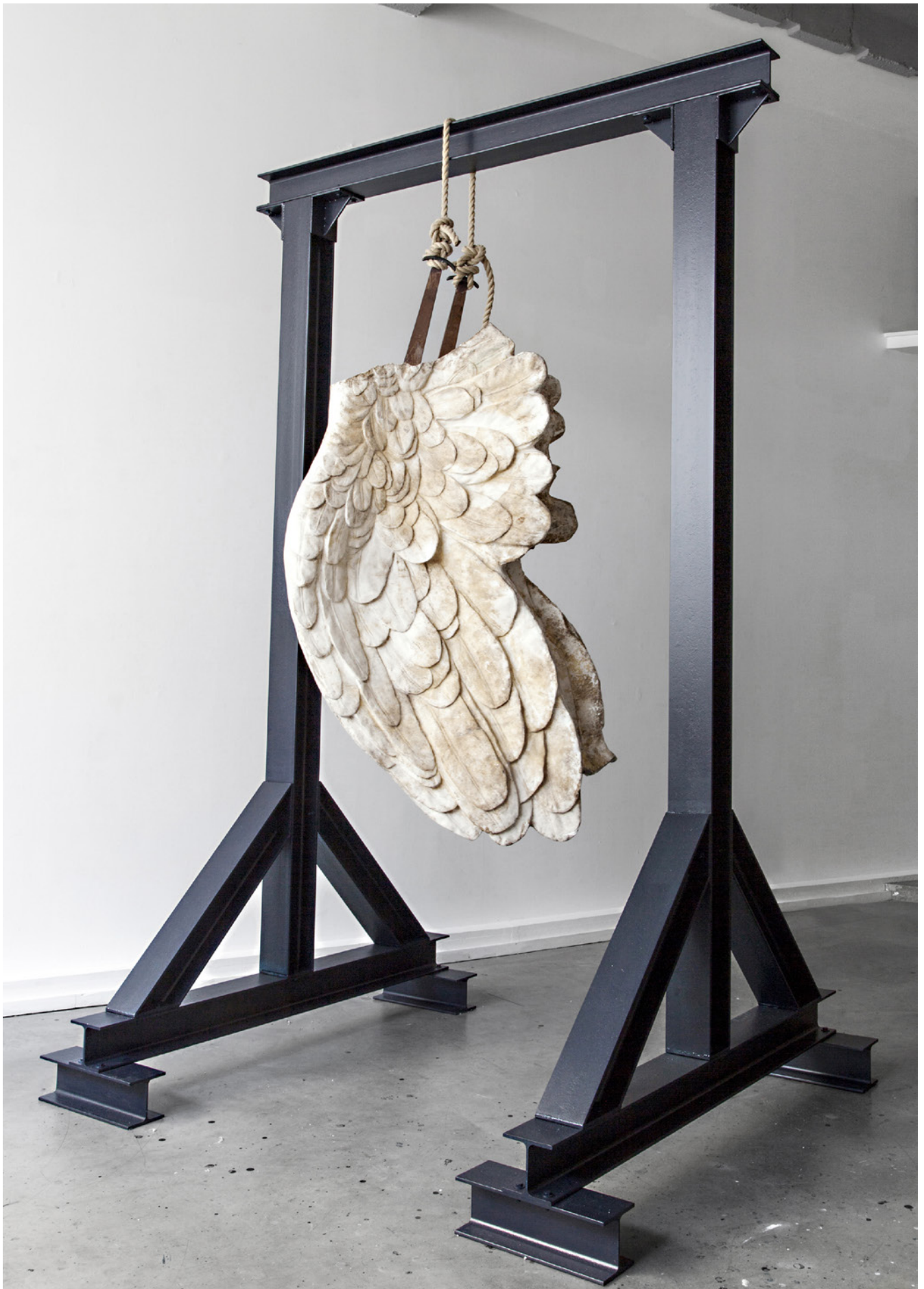
LA DYNAMIQUE DES RESTES : LES AILES DU DÉSIR, 2022

Peinture, acier, plâtre 280 x 175 x 150 cm