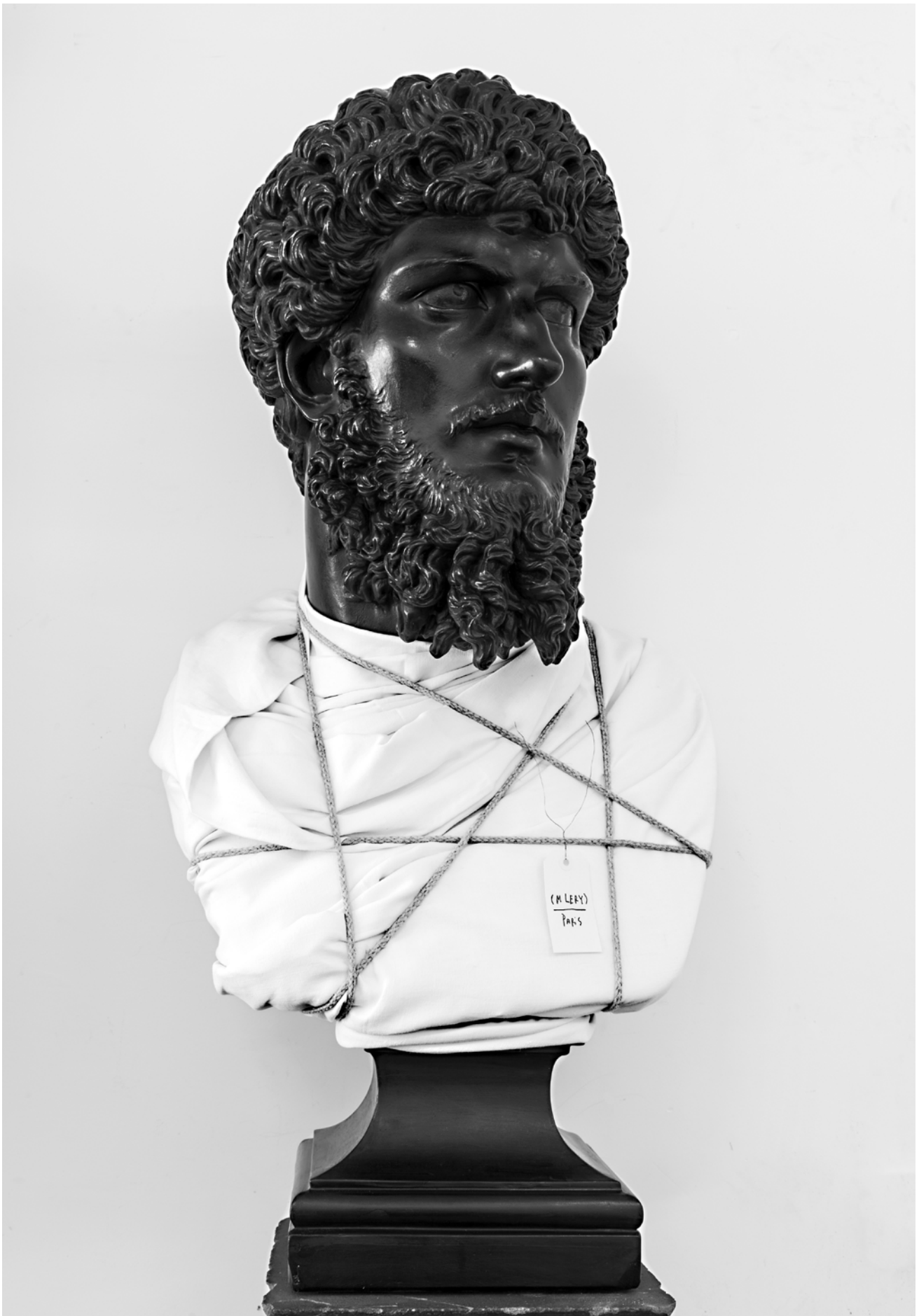
LA LOI NORMALE DES ERREURS : STATUAIRES - (M.LERY), 2021

Plâtre, textile, cordages, encaustique et graphite sur étiquette 107 x 54 x 50 cm