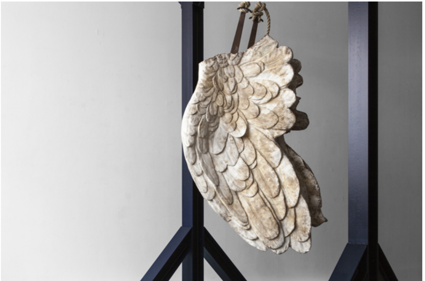
(p1) LA LOI NORMALE DES ERREURS : D'UN MUSÉE L'AUTRE - wood, painting, graphite and documentation, 200 x 320 x 70 cm - 2022

The artwork can only exist through the how it is perceived. The closing of museums during the pandemic reminded us of this. Raphaël Denis seeks to reactivate our gaze on the fate of an artwork, reflections of the violence and troubles of human history.