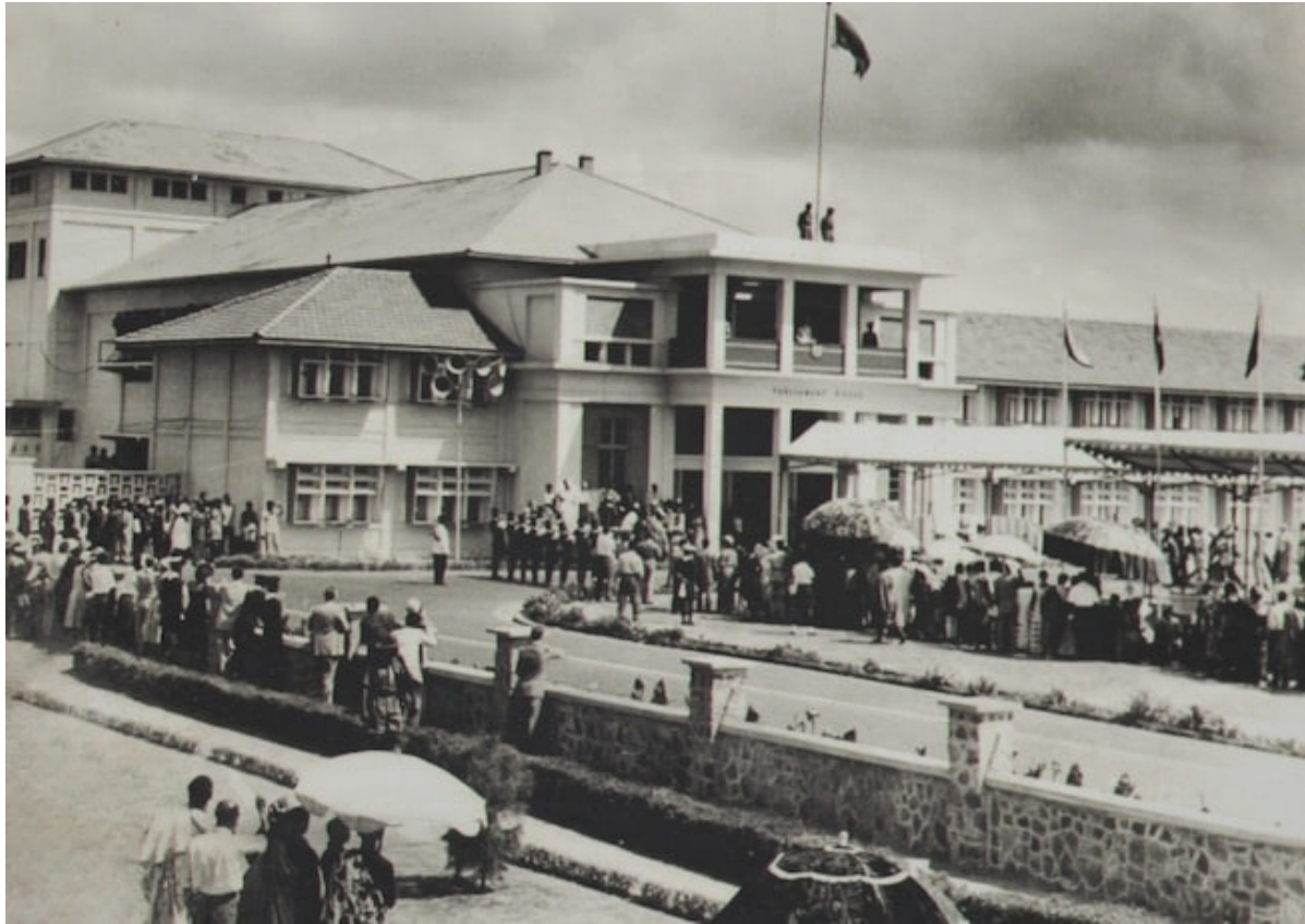
Le premier Parlement du Ghana, à Accra

à un colonialisme considéré comme trop coûteux pour la métropole, comme l'a illustré le cartiérisme (1). D'autre part, le traité de Rome institue des rapports économiques, financiers et commerciaux, alors que le terme d'Eurafrique a pu aussi recouvrir un sens très politique, ce que prétendent d'ailleurs prouver Hansen et Jonsson. Les exemples de l'usage du concept d'Eurafrique renvoient dans la majorité des cas, bien plus qu'à une construction politique, à la volonté de continuer à profiter des matières premières africaines tout en exportant en Afrique des biens manufacturés. Rares sont les occurrences vraiment politiques du mot, rares sont les constructions d'une Eurafrique politique.